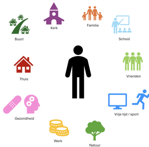
Leefgebieden van jeugdigen